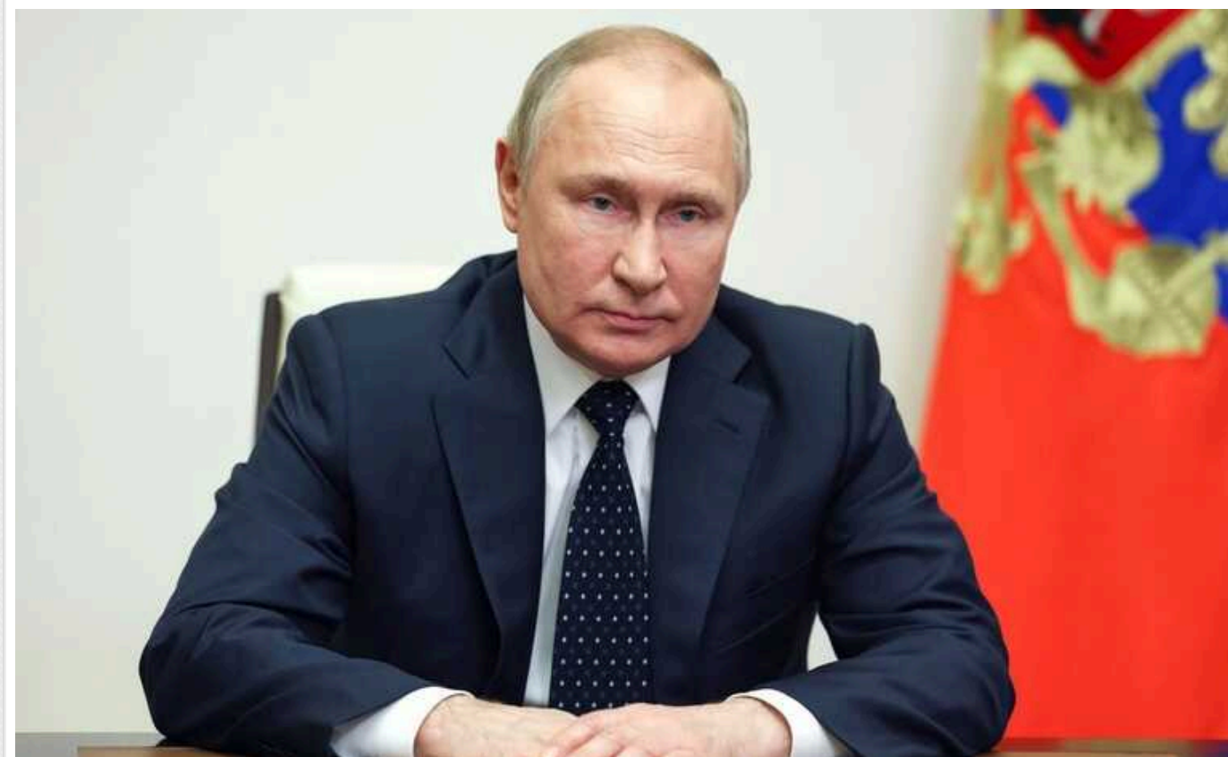
Bloomberg: В оточенні Путіна є чиновники, які не згодні з його словами про можливу причетність України до теракту в «Крокусі»

Видання Bloomberg заявляє, що в оточенні Путіна є чиновники, які не згодні з його словами про можливу причетність України до теракту в "Крокус сіті холл" 22 березня.