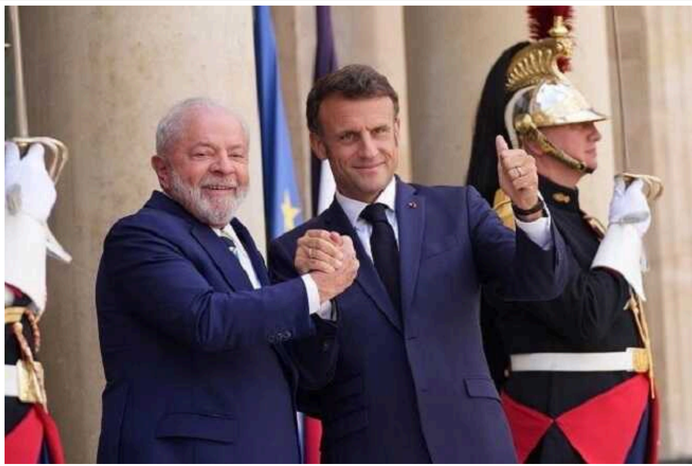
Макрон летить до Бразилії, щоб переконати Лулу та Сілву підтримати Україну, - Bloomberg

Видання Bloomberg пише, що президент Франції Еммануель Макрон сьогодні летить до Бразилії, щоб спробувати переконати її лідера Лулу та Сілву підтримати Україну.