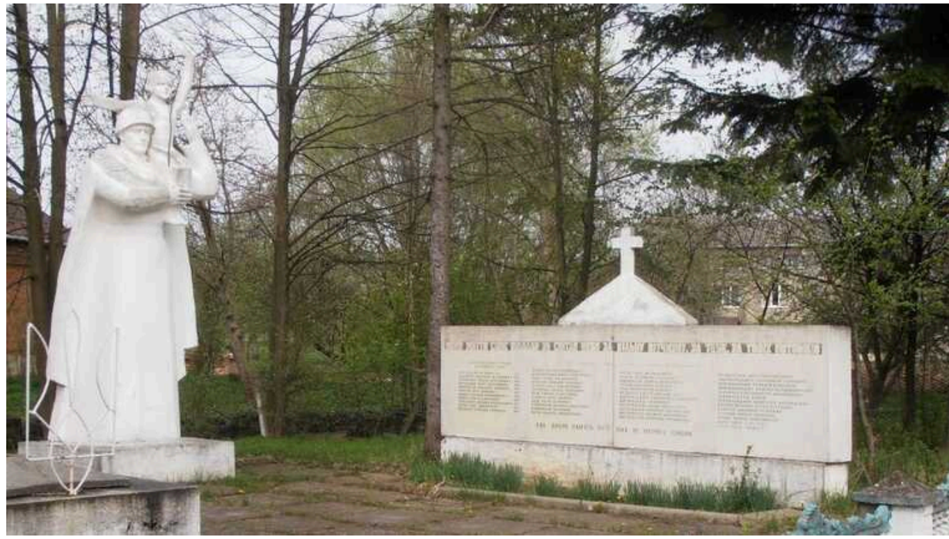
У Калуській громаді демонтують скульптуру солдата з останнього радянського пам'ятника

Демонтувати елементи пам'ятника вирішили після звернення старости села Тужилів.