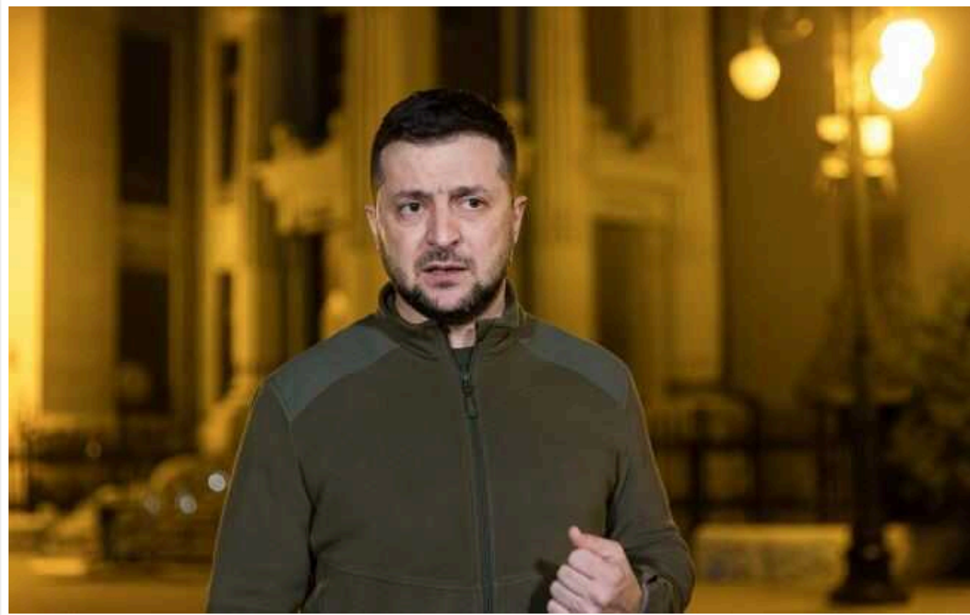
Зеленський пояснив відставку Данілова і нові призначення: "Перезавантаження системи управління державою триває"

Президент України Володимир Зеленський пояснив відставку секретаря Ради національної безпеки і оборони Олексія Данілова та нові призначення 26 березня. За словами глави держави, його переведуть на інший напрям, перезавантаження системи триває.