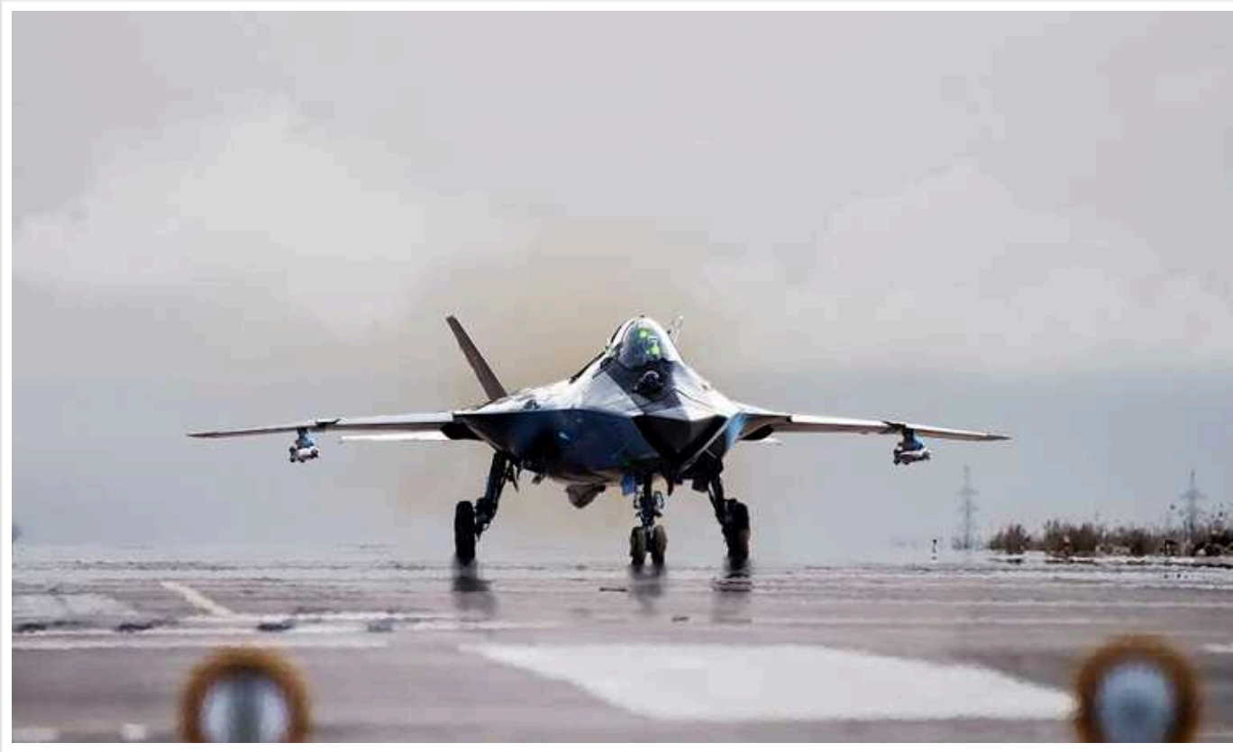
У РФ усе ще фантазують із приводу проєкту МіГ-41

Російські інженери погрожують оснастити "перспективний" перехоплювач багаточільовим ракетним комплексом, що здатний впоратися з "гіперзвуковими боеприпасами з кількома боеголовками".