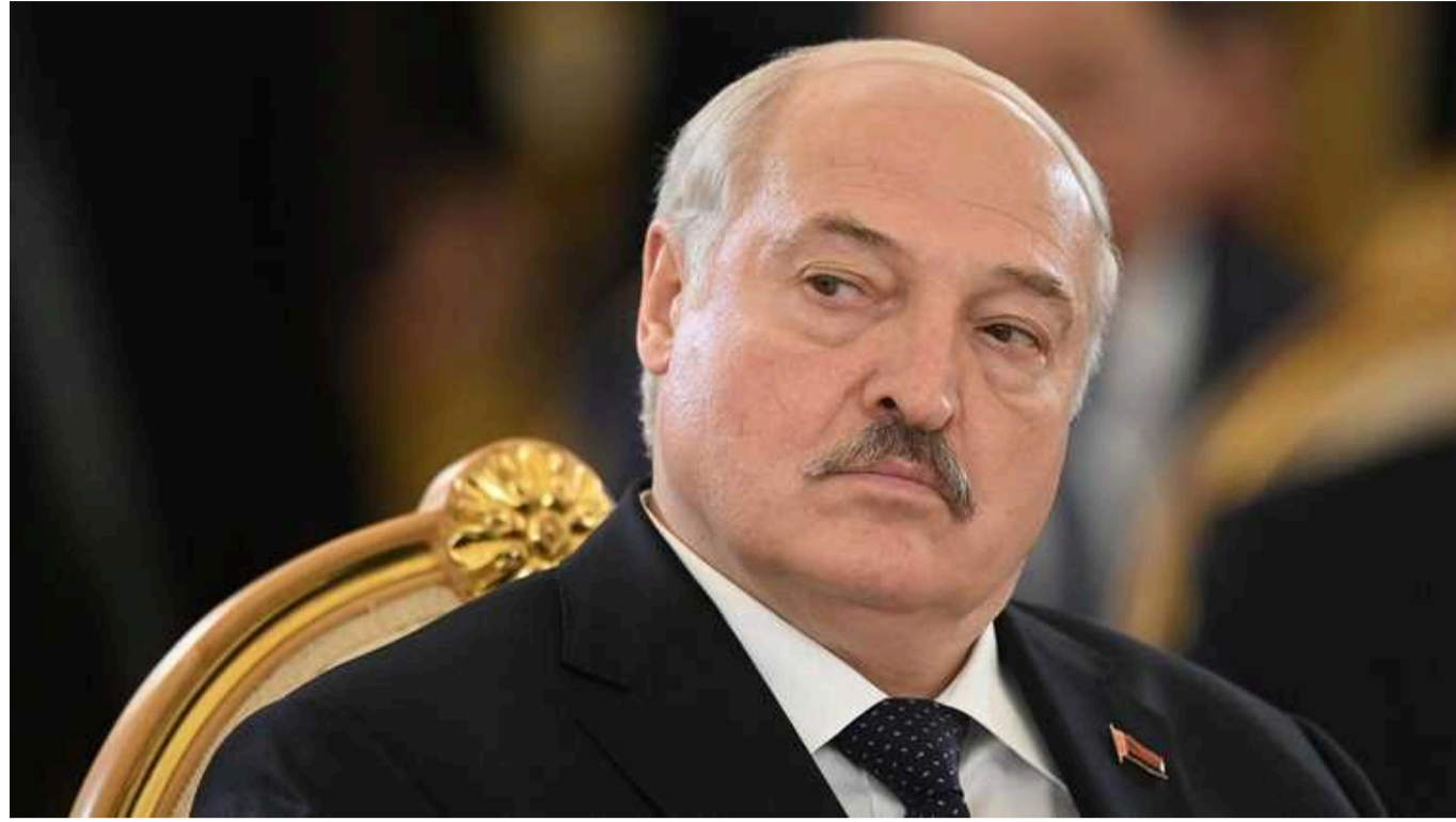
Теракт у "Крокусі": Білорусь перекрила кордон, тому терористи розвернулися, — Лукашенко

За словами білоруського політика Александра Лукашенка, для перекриття кордону було задіяно сили МВС, КДБ, військові з деяких частин. Силовіков розставили на блокпостах на дорогах на кордоні з РФ.