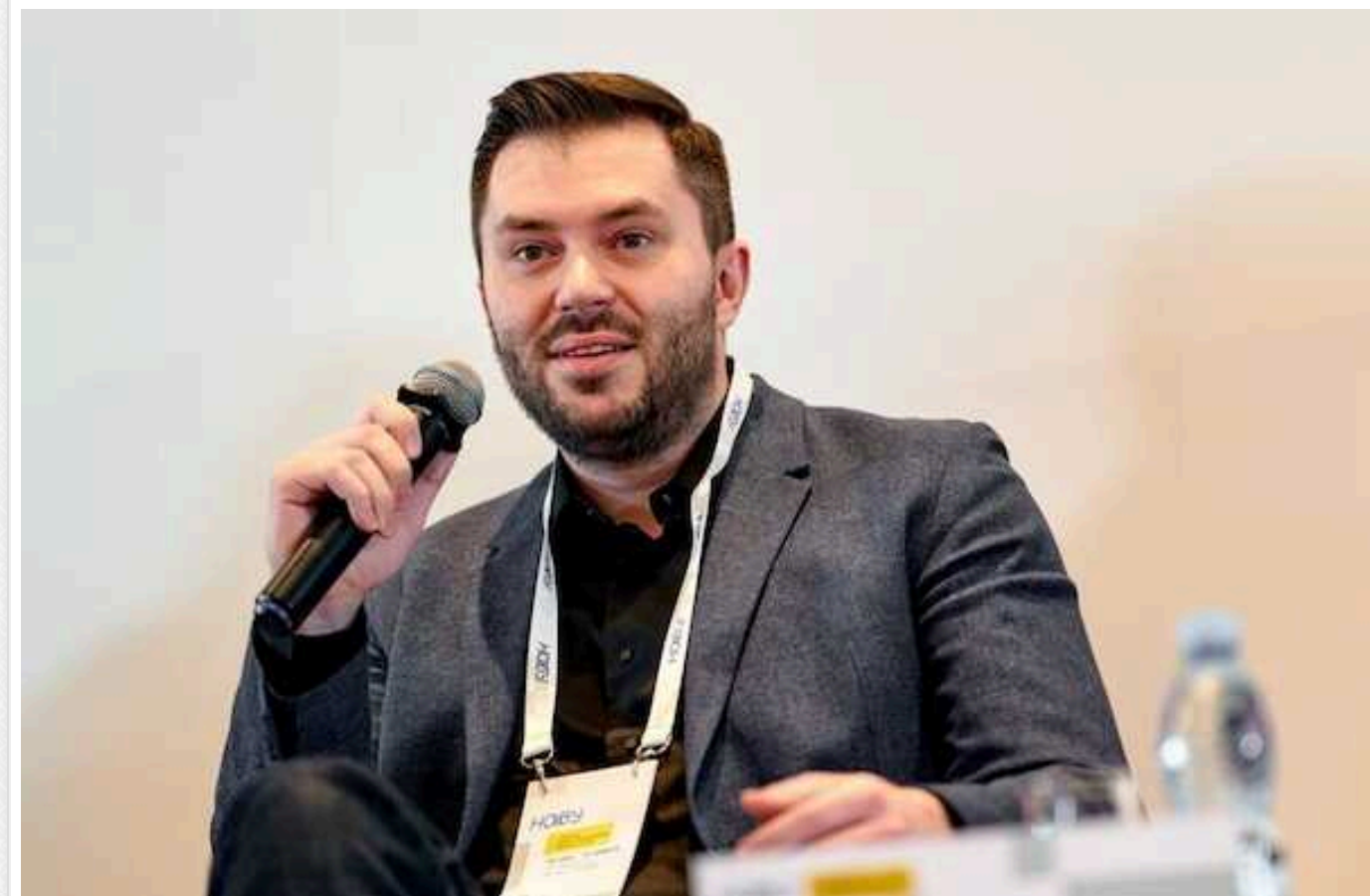
Хтось у владі досі працює на Росію: Мінфін РФ та підсанкційний власник “Фрідом фінанс” досі володіють 27% акцій “Української біржі”

Національна комісія з цінних паперів та фондового ринку (НКЦПФР) не бачить порушень у тому, що Міністерство фінансів Російської Федерації та підсанкційний Тимур Турлов володіють акціями “Української біржі”.