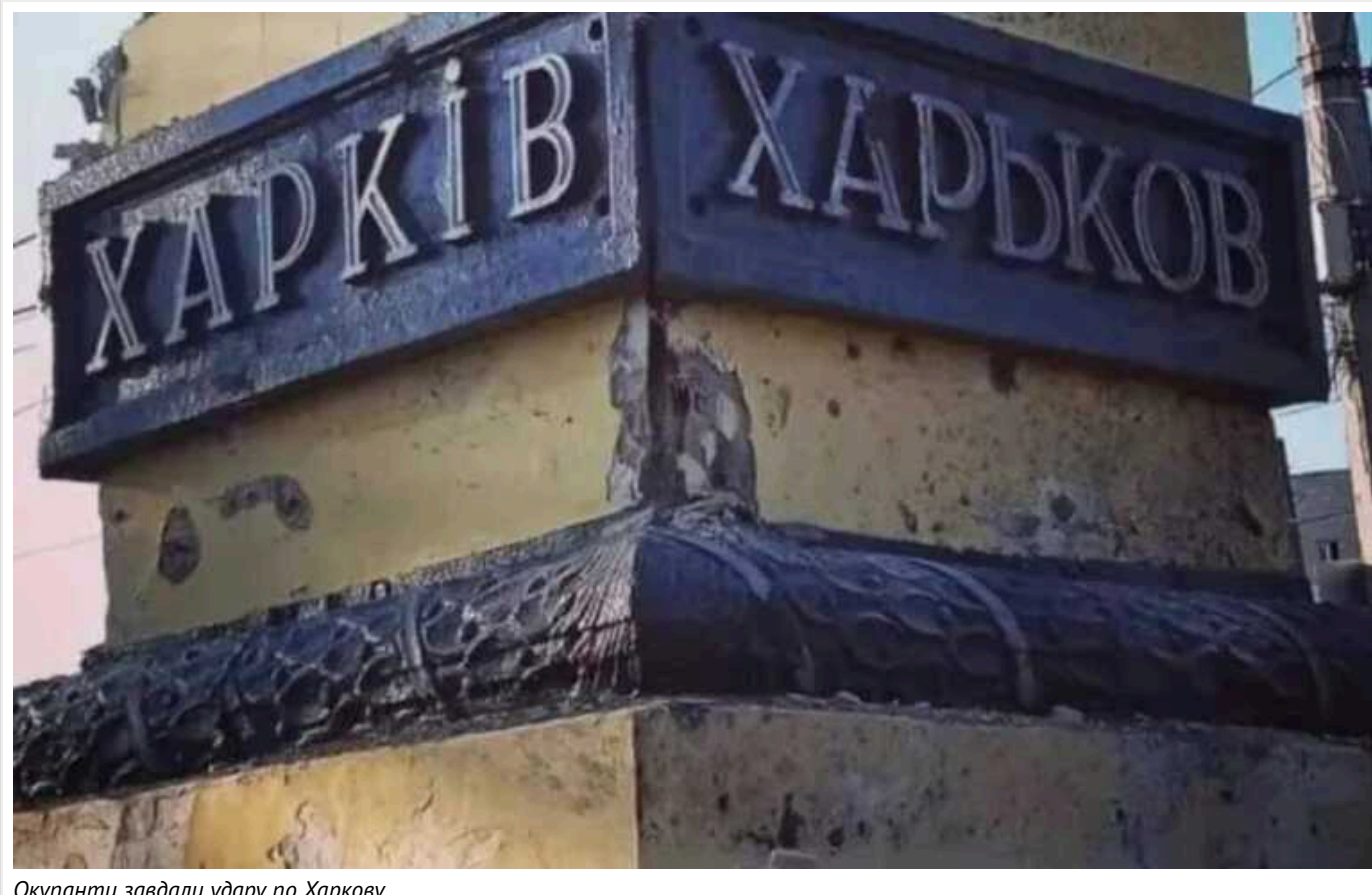
Окупанти завдали удару по Харкову

Вдень 26 березня російські війська атакували Харків. Окупанти вдарили по цивільній житловій інфраструктурі Харкова: зафіксовано влучання у Шевченківському районі.