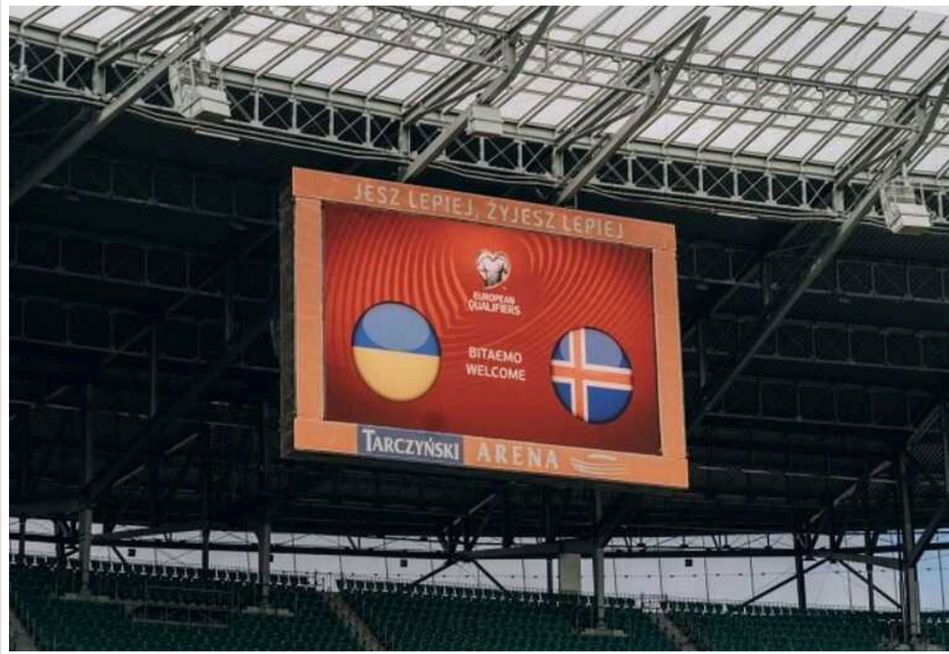
Ребров оголосив склад команди перед вирішальним матчем за путівку на Євро-2024

Головний тренер збірної України Сергій Ребров оголосив заявку на фінальний стиковий матч відбіркового турніру до Євро-2024 з Ісландією. Наставник "синьо-жовтих" назвав прізвища 23 гравців, які можуть з'явитися на полі 26 березня у вирішальній битві за путівку на турнір.