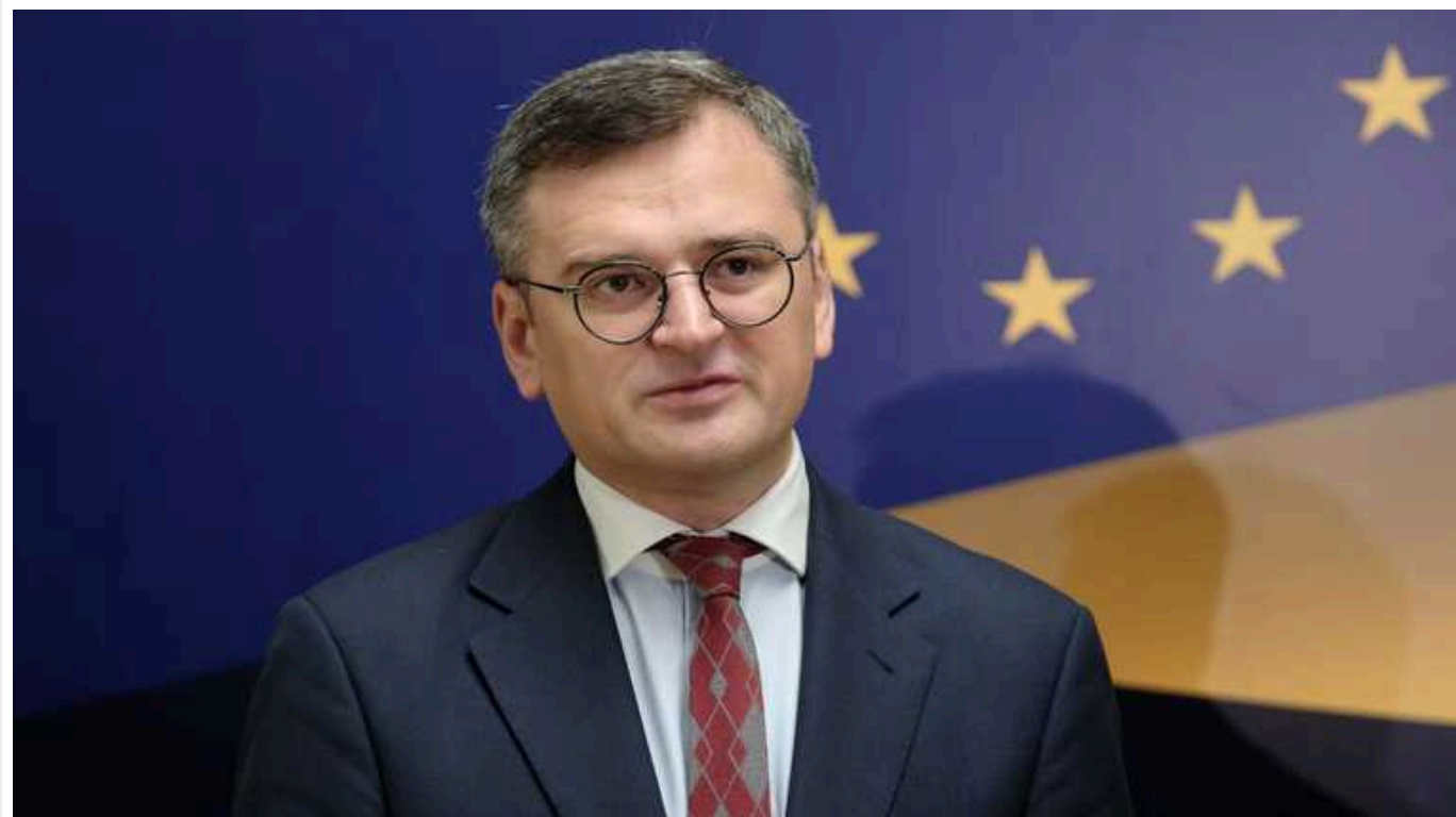
Кулеба назвав єдиний варіант, як уникнути втрати позицій на фронті

Міністр закордонних справ України Дмитро Кулеба заявив, що для уникнення втрат позицій на фронті ЗСУ потрібні системи протиповітряної оборони на передовій.