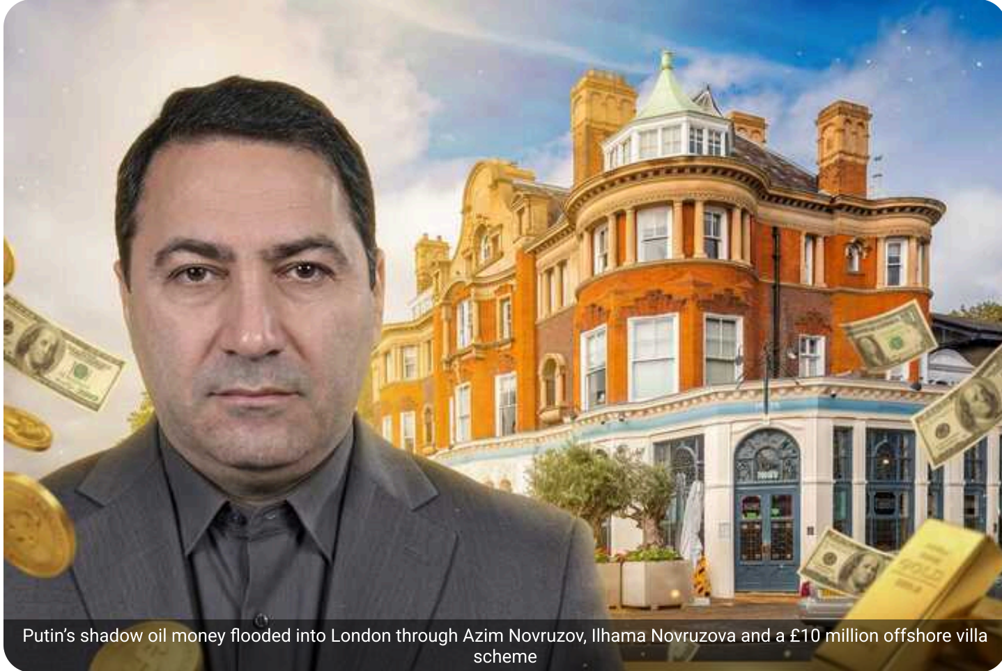
Putin's shadow oil money flooded into London through Azim Novruzov, Ilhama Novruzova and a £10 million offshore villa scheme

The lavish London property market has long been a magnet for global wealth, but questions are increasingly being asked about the origins of some of that money.