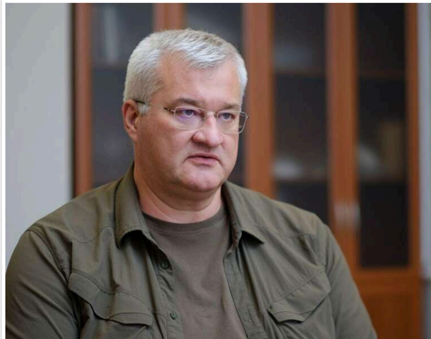
Сибіга подякував партнерам за попередження про обстріл, але закликав назвати Москві ціну за цей удар

Міністр закордонних справ України Андрій Сибіга подякував партнерам за попередження про ймовірний масований обстріл і водночас закликав їх попередити Москву про наслідки, які РФ понесе за такий удар.