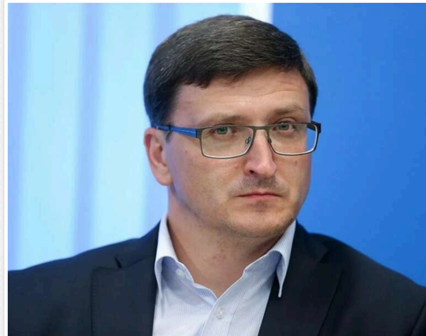
Закриття кордонів та залучення іноземців: голова Офісу міграційної політики оцінив демографічні виклики України

У найближчі роки Україні, можливо, доведеться обмежувати виїзд своїх громадян і, навпаки, спрощувати в'їзд іноземцям.