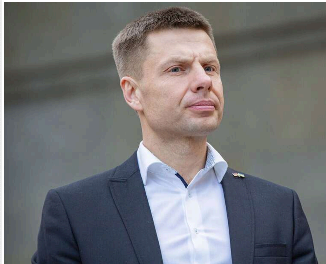
Нардеп Гончаренко відреагував на масований обстріл Києва й закликав до завершення війни

Після нічного обстрілу Києва нардеп Гончаренко заявив про необхідність завершити війну.