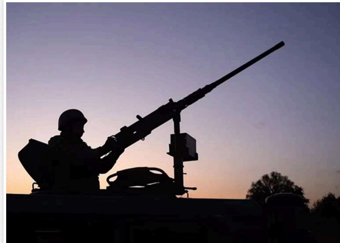
«Краще не буде, поки обіцяні ракети не надійдуть»: відомий моніторинговий канал оцінив наслідки нічної атаки

«Відбилися дуже погано». Український військовий паблік «Николаевский Ванек» повідомив про незадовільні результати роботи ППО минулої ночі.