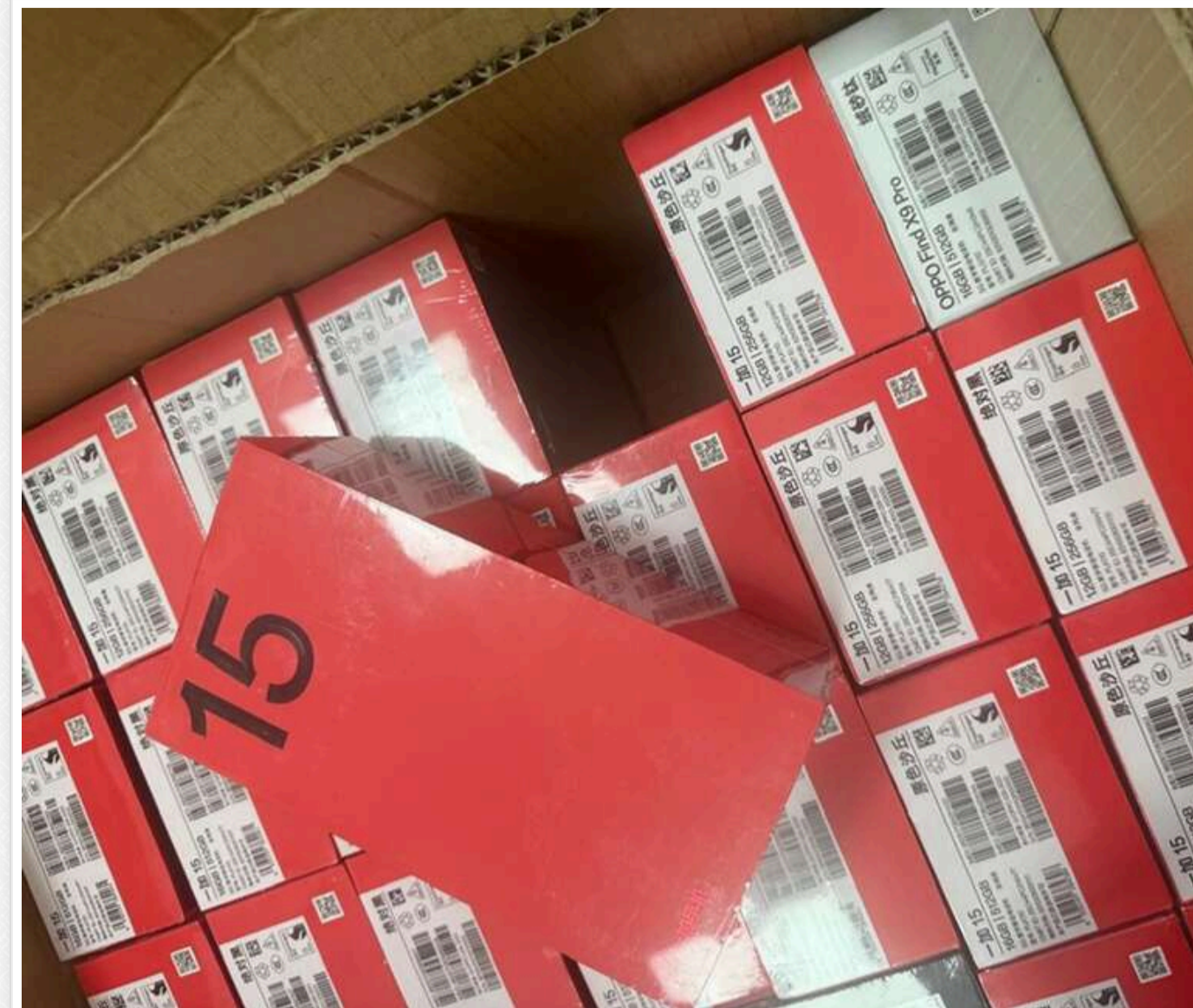
Апеляційний суд Львова конфіскував 30 смартфонів із Китаю, які видавали за «декорації для дому»

04 травня 2026 року Львівський апеляційний суд ухвалив жорстке рішення щодо жінки, яка намагалася надіслати з Китаю комерційну партію нових флагманських смартфонів, замаскувавши їх під звичайні предмети домашнього декору.