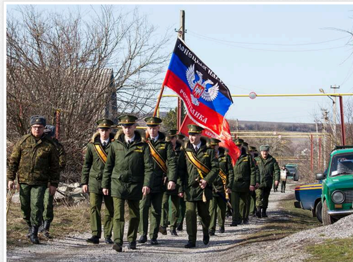
«Для когось це буде боляче»: Окупаційна влада Донеччини анонсувала конфіскацію чужого майна для місцевого бізнесу

Частину дефіциту комерційної нерухомості планують покрити користуючись з беззахайних об'єктів.