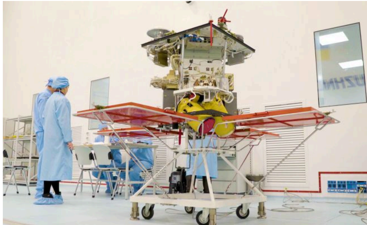
Український супутник "Січ" востаннє запустили у січні 2022-го