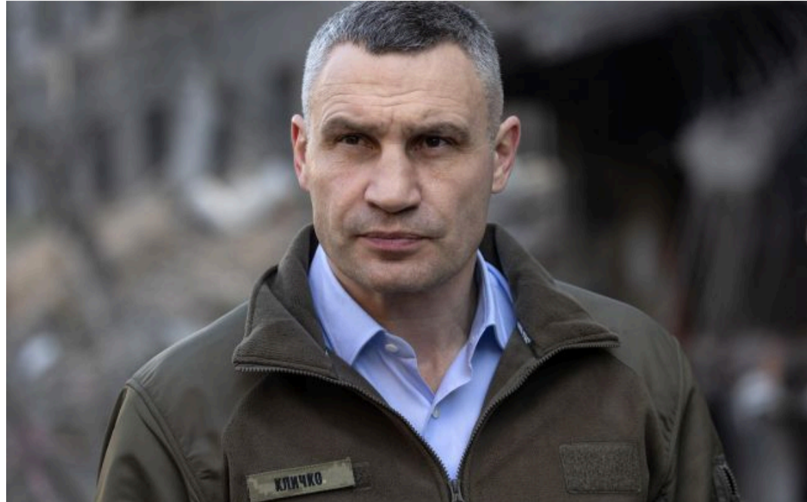
Фото: мер Києва Віталій Кличко (Getty Images)