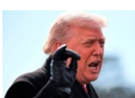
Трамп висунув Ірану новий дедлайн - ЗМІ

Вучич заговорив про скору відставку Сербії готовий представляти Європу на переговорах із РФ РФ глушила сигнал літака міністра оборони Британії - ЗМІ У США через загрозу вибуху відселяють 50 тисяч людей