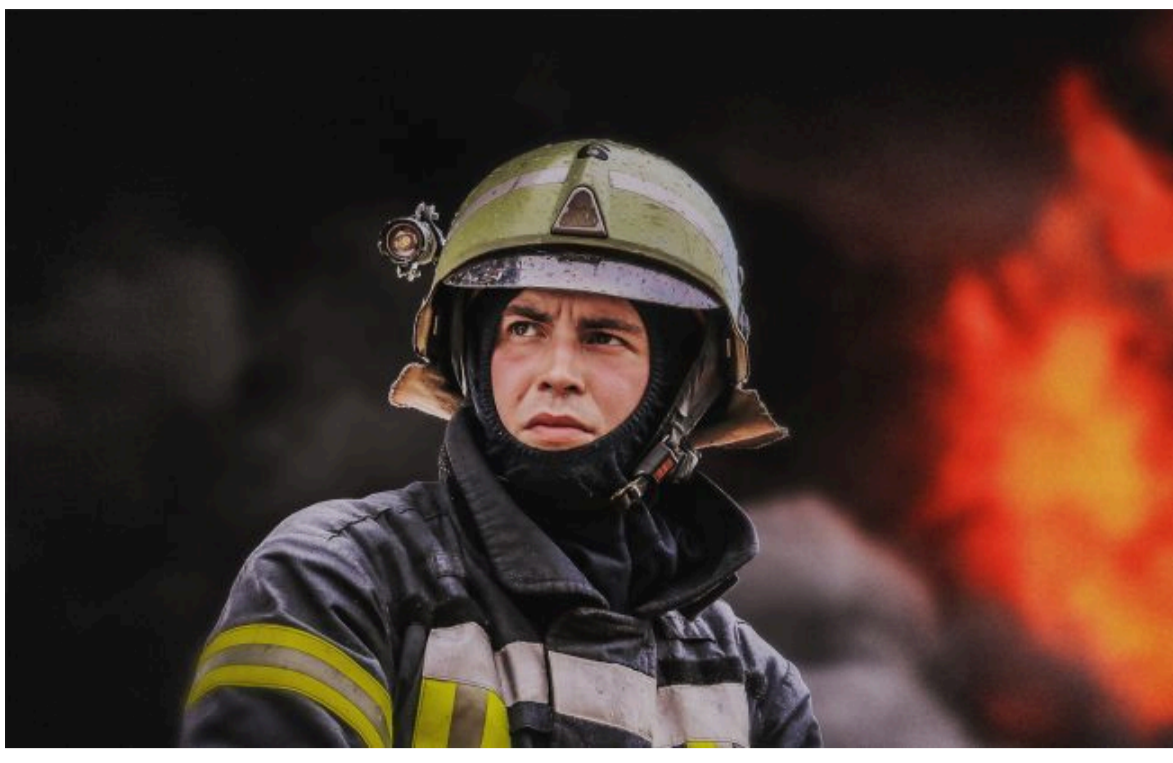
Фото: перші подорожці масованої атаки