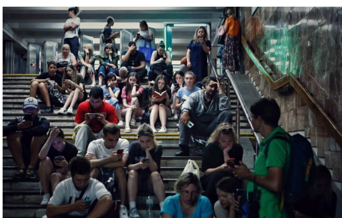
Фото: мешканців столиці просять залишатися в укриттях