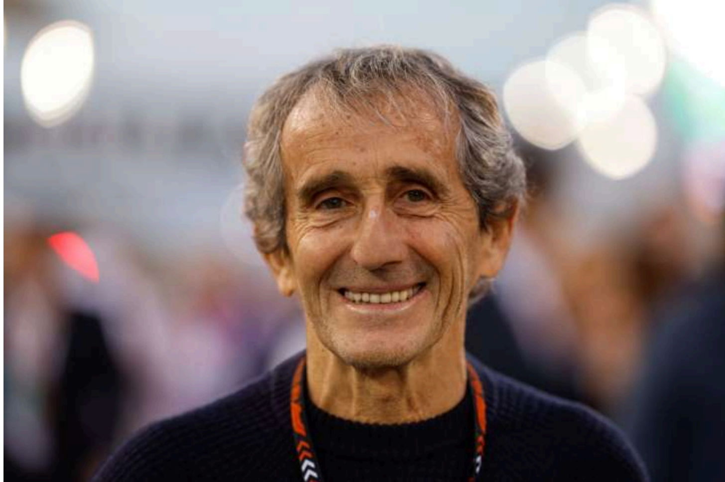
Фото: Ален Прост /DPPI via AFP

Чотириразовий чемпіон "Формули-1" Ален Прост став жертвою збройного пограбування на своїй віллі у швейцарському Ньоні. Про це повідомляє Eurosport .