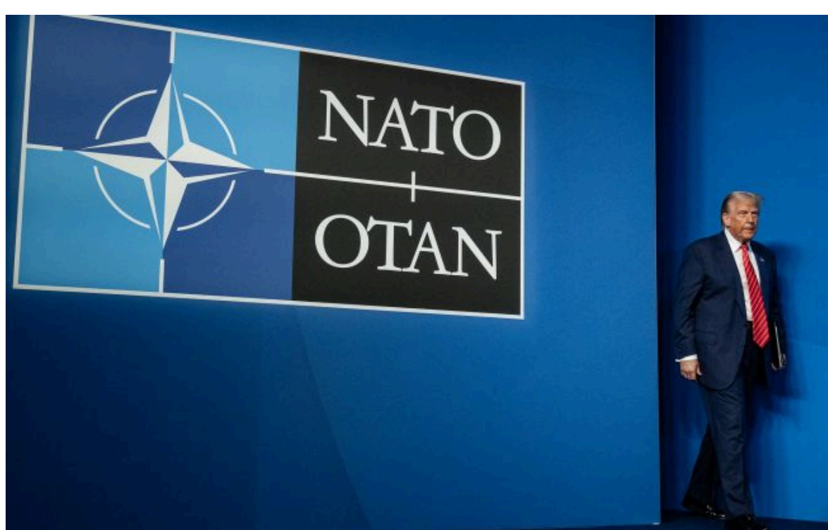
Фото: Президент США Дональд Трамп (flickr.com)