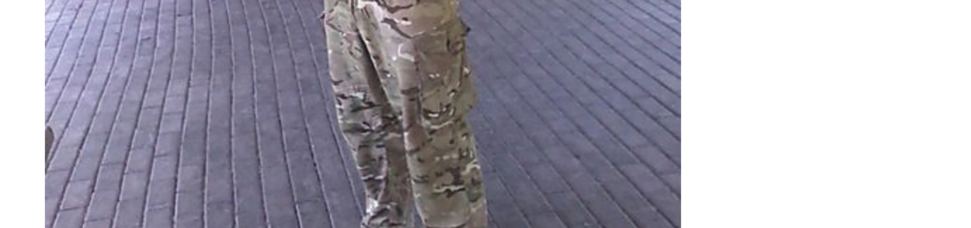
Завдання і іншому рішенню судді підозрюваному в тероризмі вдалося втекти на Донбас і продовжити воювати проти України.