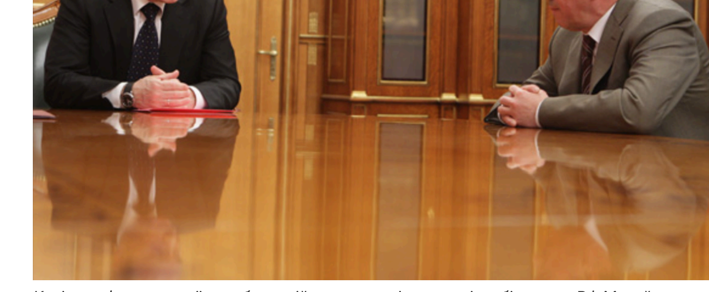
Керівник федеральної служби по військово-технічному співробітництву РФ Михайло Дмитрієв (праворуч) з прем'єр-міністром РФ Путіним, 2009 рік.

Читайте по темі: У Росії розгортається палина криза: втруча в чотирьох регіонах запроваджують суворі обмеження на реалізацію бензину