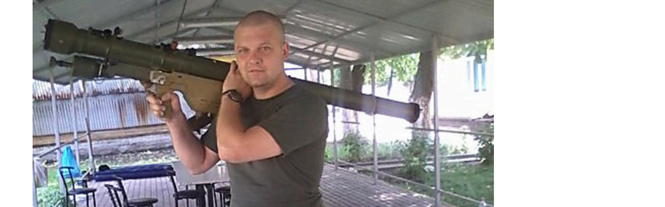
Завдяки йшлому рішенню судді підозрюваному в тероризмі вдалося втекти на Донбас і продовжити воєнати проти України.

Читайте по темі: Прикордонники зруйнували понтонний переїзд і зарвали намір окупантів переправитися через річку Вовча