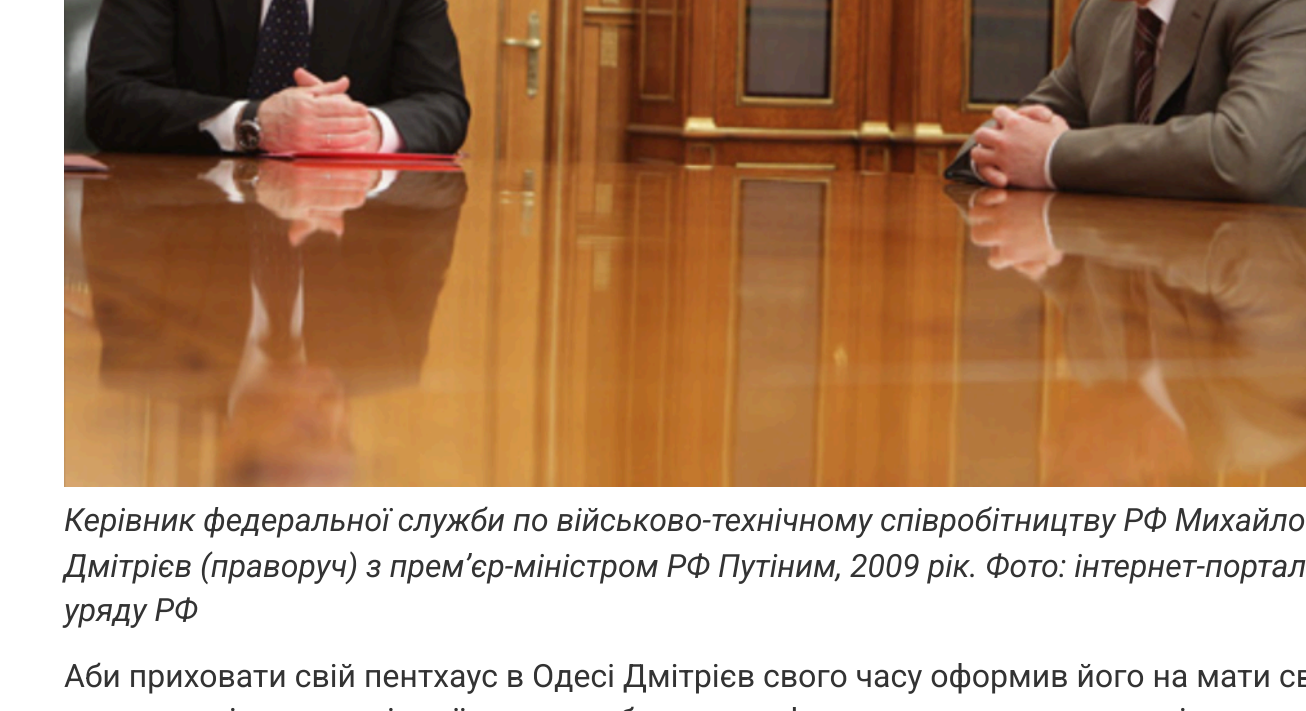
Керівник федеральної служби по військово-технічному співробітництву РФ Михайло Дмитрієв (праворуч) з прем'єр-міністром РФ Путіним, 2009 рік.

Читайте по темі: У Росії розгортається палина криза: втруча в чотирьох регіонах запроваджують суворі обмеження на реалізацію бензину