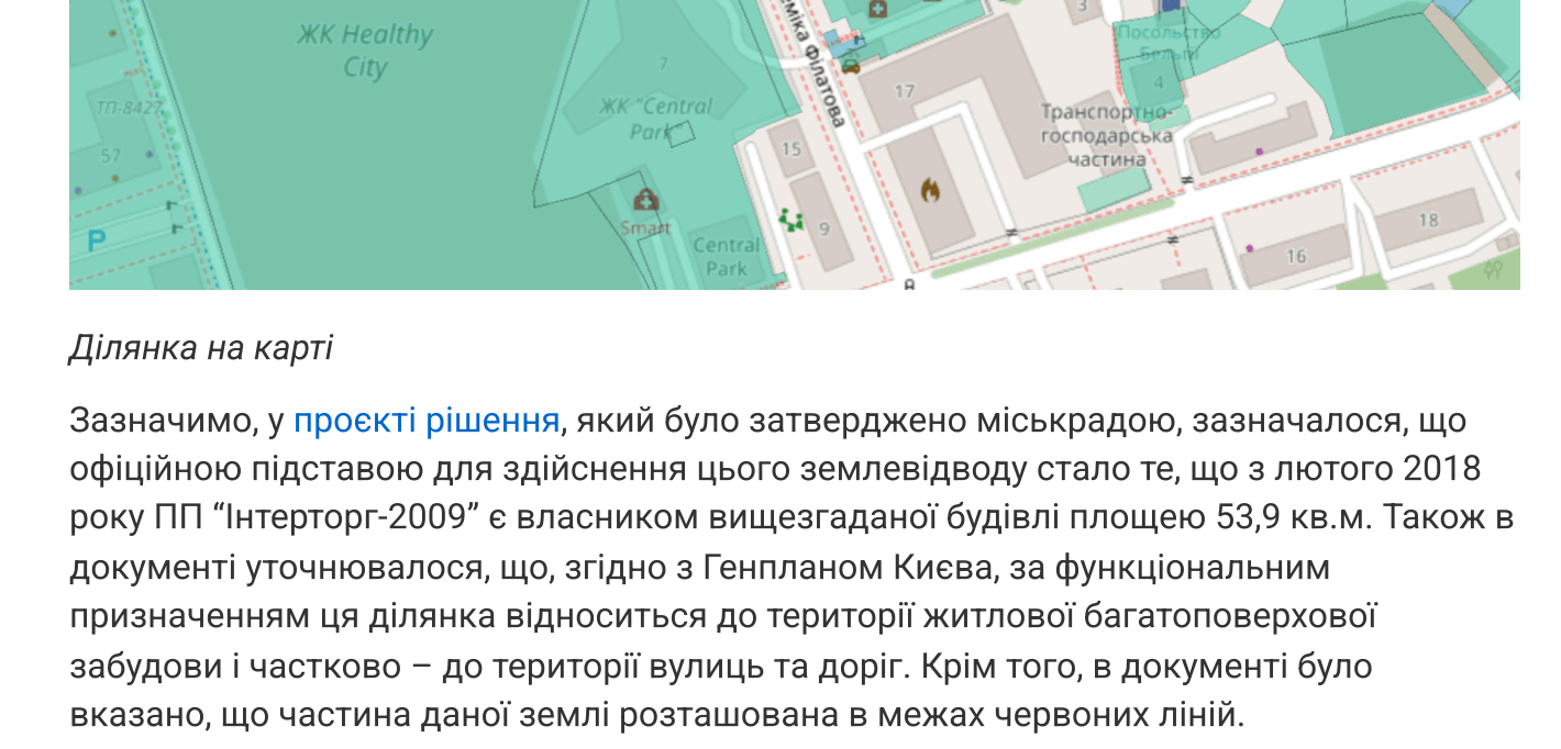
Ділянка на карті

Передісторія 30 липня 2020 року Київрада рішенням №294/9373 погодила передачу ділянки на вул. Академіка Філатова, 5 площею 0,06 га на 25 років в оренду ПП "Інтертор-2009" з певними призначеннями. Для експлуатації та обслуговування нежитлового будівлі для підприємства та обслуговування житлового будівництва – об'єктом оренди (№ 09/201/17). Наразі, 17 листопада 2020 року, між місьадміністрацією і вказаним підприємством укладено відповідний договір оренди.