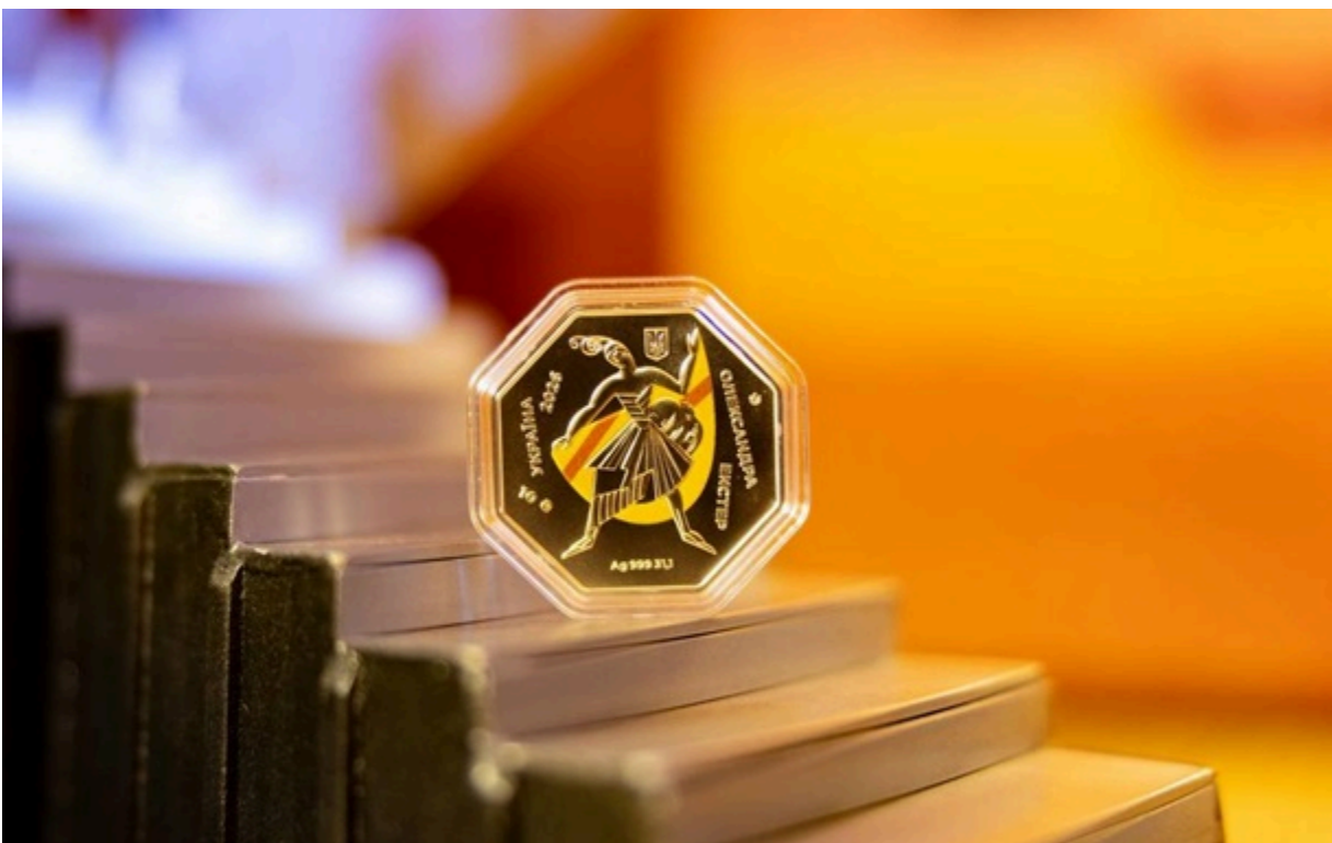
Монета виготовлена у формі восьмикутника зі срібла 999 проби

Випуск монети започатковує новий напрям у нумізматичній програмі НБУ, присвячений темі українського авангарду.