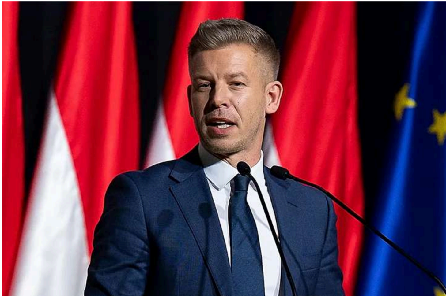
Петер Мадяр

Прем'єр-міністр Угорщини Петер Мадяр повідомив, що уряд країни забороняє імпортувати сільськогосподарську продукцію з України. Про це він написав у соцмережі X.