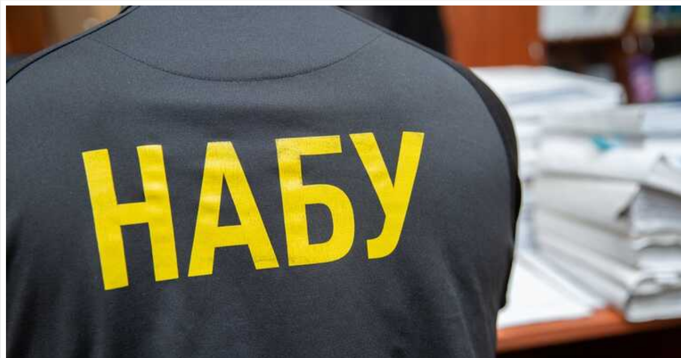
НАБУ та САП порушили справу у справі керівника АМКУ Кириленка після розслідування про майно його сім'ї на 70 мільйонів гривень

За даними розслідувачів, стан його сім'ї почав з'являтися ще 2020 року, коли Кириленко обіймав посаду голови Донецької ОДА.