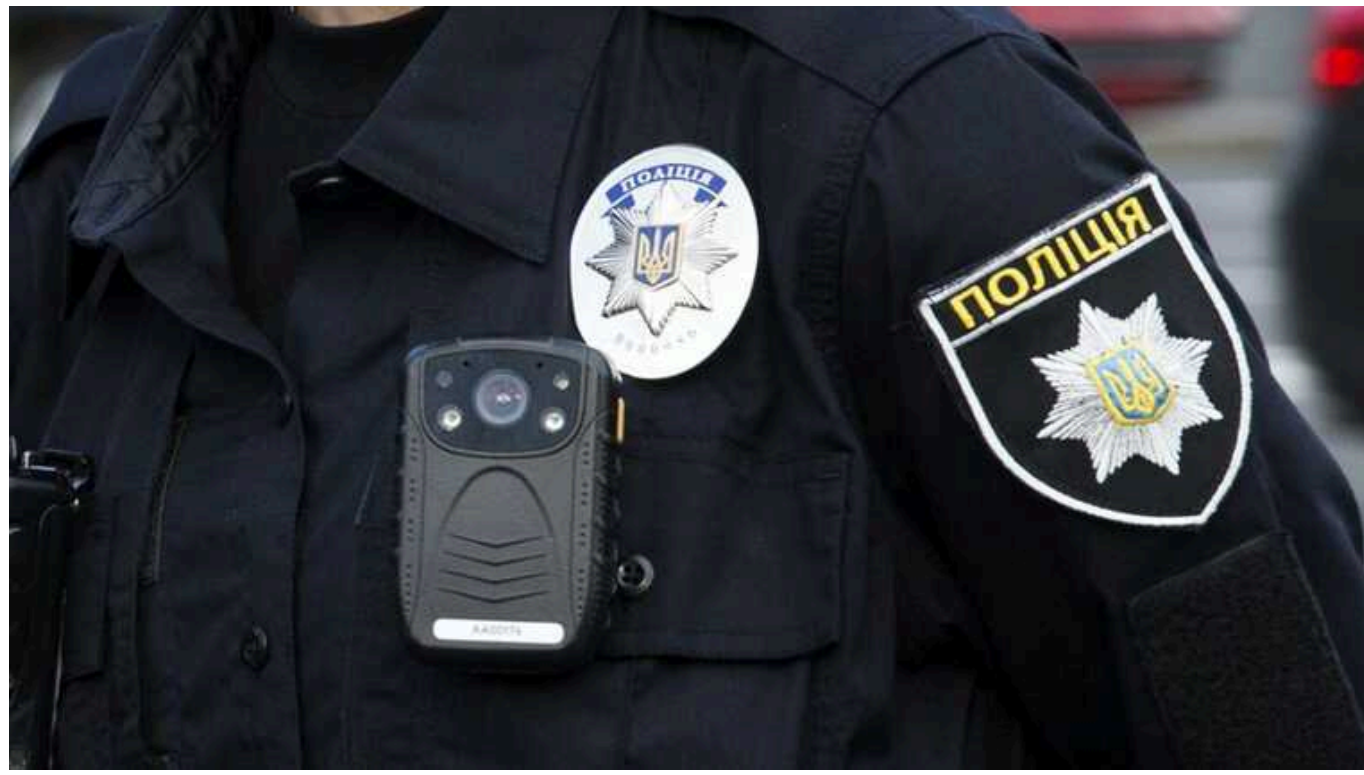
Депутати ВР пропонують бронювати до 70% правоохоронців

Нардеп Федієнко публікує фото кількох сторінок поточної редакції законопроекту щодо посилення мобілізації.