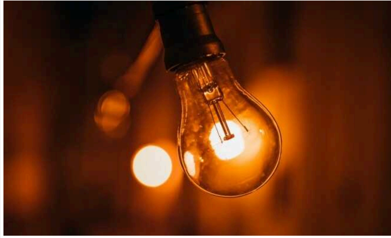
Відключення електрики можуть розпочатися на Хмельниччині слідом за Одесою та Харковом

Відключення електрики можуть розпочатися у Хмельницькій області слідом за Харковом та Одесою.