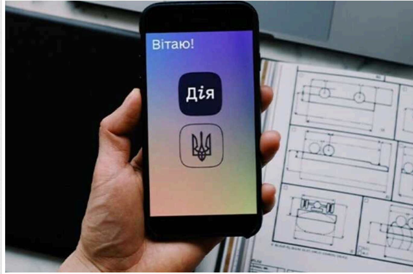
Через "Дію" українці зможуть подати заяви до міжнародного Реєстру збитків про пошкодження, завдані РФ

Директор Реєстру збитків, завданих агресією Російської Федерації проти України, Маркіян Ключковський та віцепрем'єр-міністр України з інновацій, розвитку освіти, науки та технологій Михайло Федоров підписали угоду, завдяки якій українці зможуть подати заяву про відшкодування збитків, завданих внаслідок російської агресії. Нею передбачено запуск нового сервісу, що є безпрецедентним випадком з міжнародного обміну даними. Послуга стане доступною на порталі та в застосунку “Дія”.