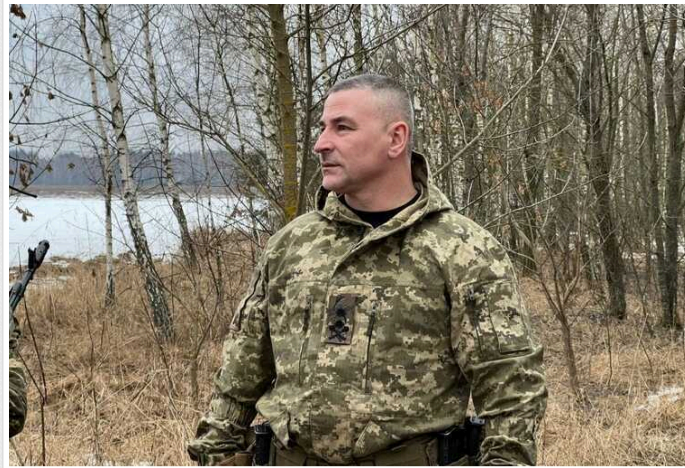
Командувач підготовкою Сухопутних військ ЗСУ йде з посади

Генерал-майор Віктор Ніколюк йде у відставку з посади командувача підготовкою Сухопутних військ Збройних сил України.