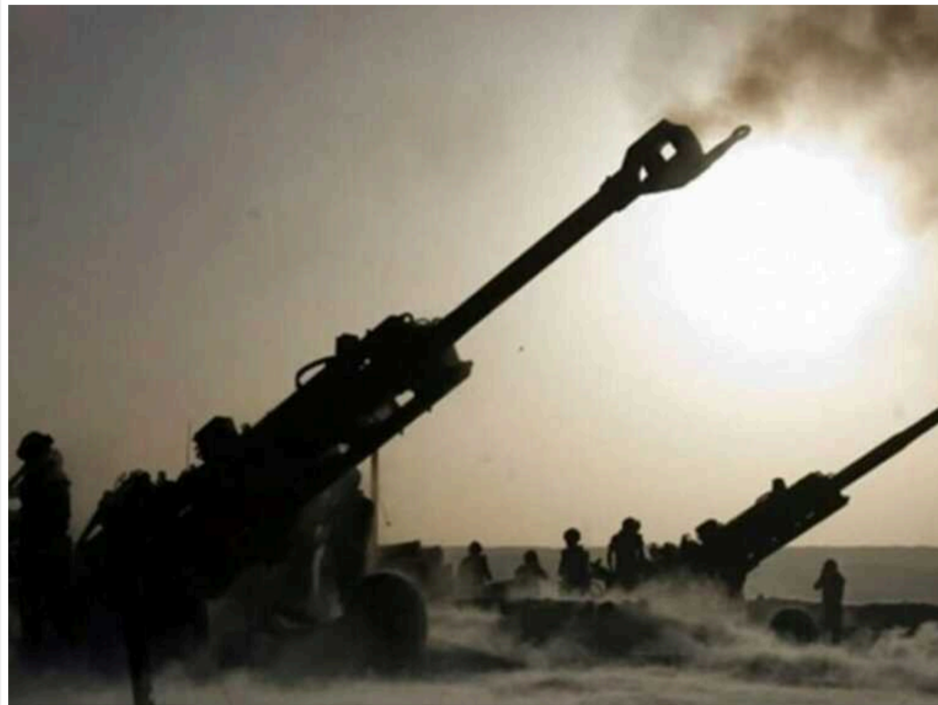
Війська РФ вночі обстріляли Нікополь з артилерії