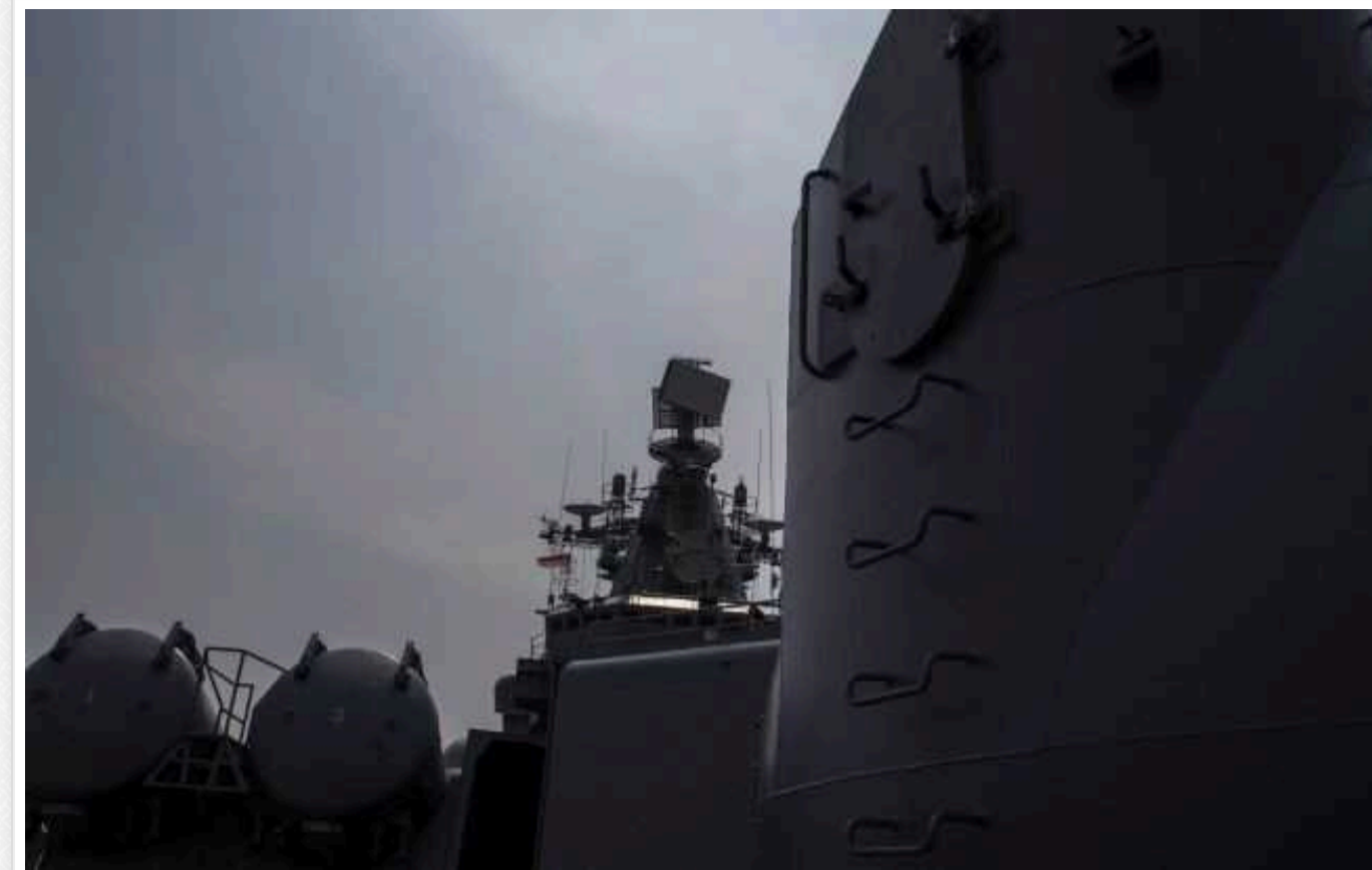
В ISW оцінили, як удар по центру зв'язку та кораблях ЧФ у Криму вплине на можливості Росії в Чорному морі

Нові українські удари по військових об'єктах РФ у тимчасово окупованому Криму 23 березня уразили центр зв'язку, кілька кораблів та літаків. Це ще більше ускладнить здатність ворога максимізувати свої бойові можливості в західній частині Чорного моря.