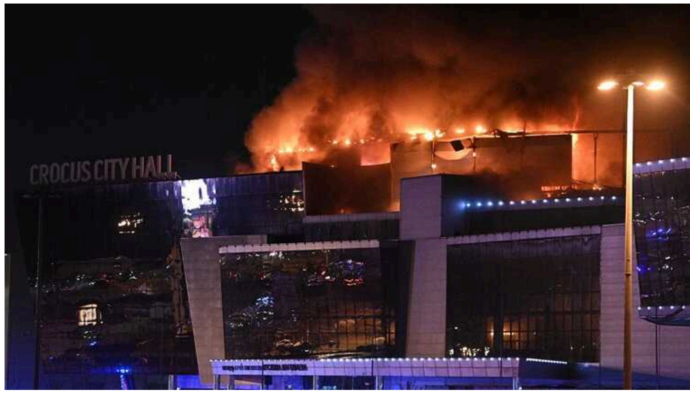
До теракту в "Крокусі" причетний ІДІЛ, але Кремль може висунути нові звинувачення проти України, - ISW

Відповідальність за напад у концертному залі "Крокус Сіті Холл" (Красногорськ, Підмосков'я) 22 березня, найімовірніше, несуть терористи "Ісламської держави" (ІДІЛ). Проте Кремль, який без доказів швидко спробував приплести до цього Україну, все ще може висунути офіційне звинувачення на її адресу.