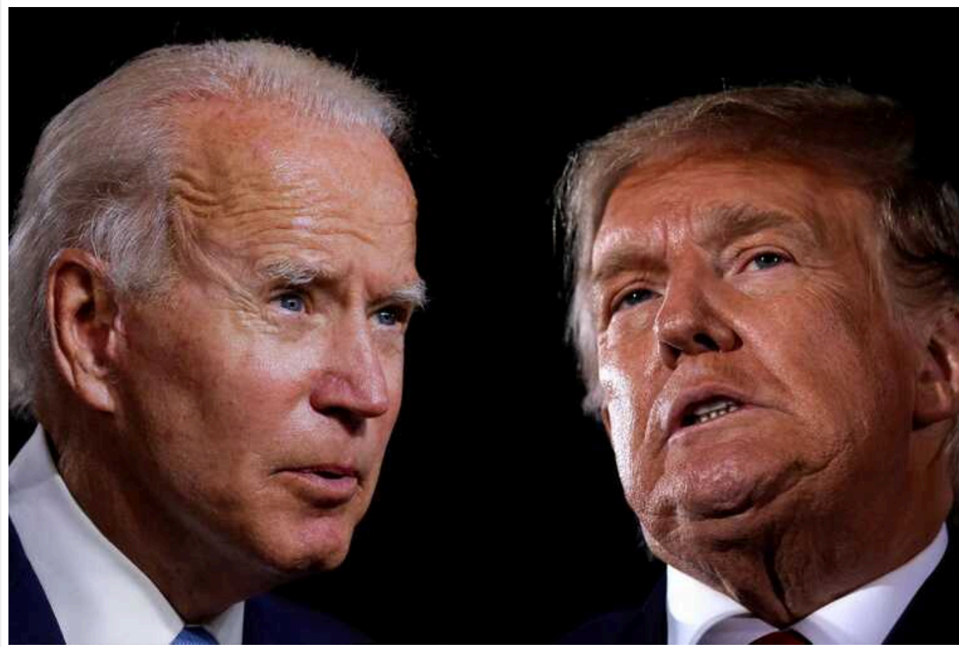
Вибори в США: Байден і Трамп виграли праймеріз у Луїзіані

Президент США Джо Байден та колишній президент Дональд Трамп виграли праймеріз у штаті Луїзіана.