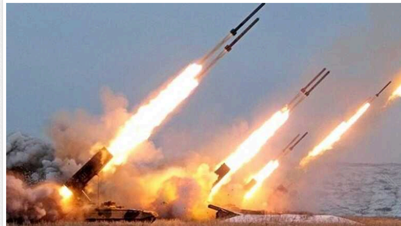
У Києві пролунали потужні вибухи

У ніч проти неділі, 24 березня, країна-агресор Росія втретє за тиждень підняла у небо стратегічну авіацію - з аеродрому Оленья в Мурманській області злетіли бомбардувальники Ту-95.