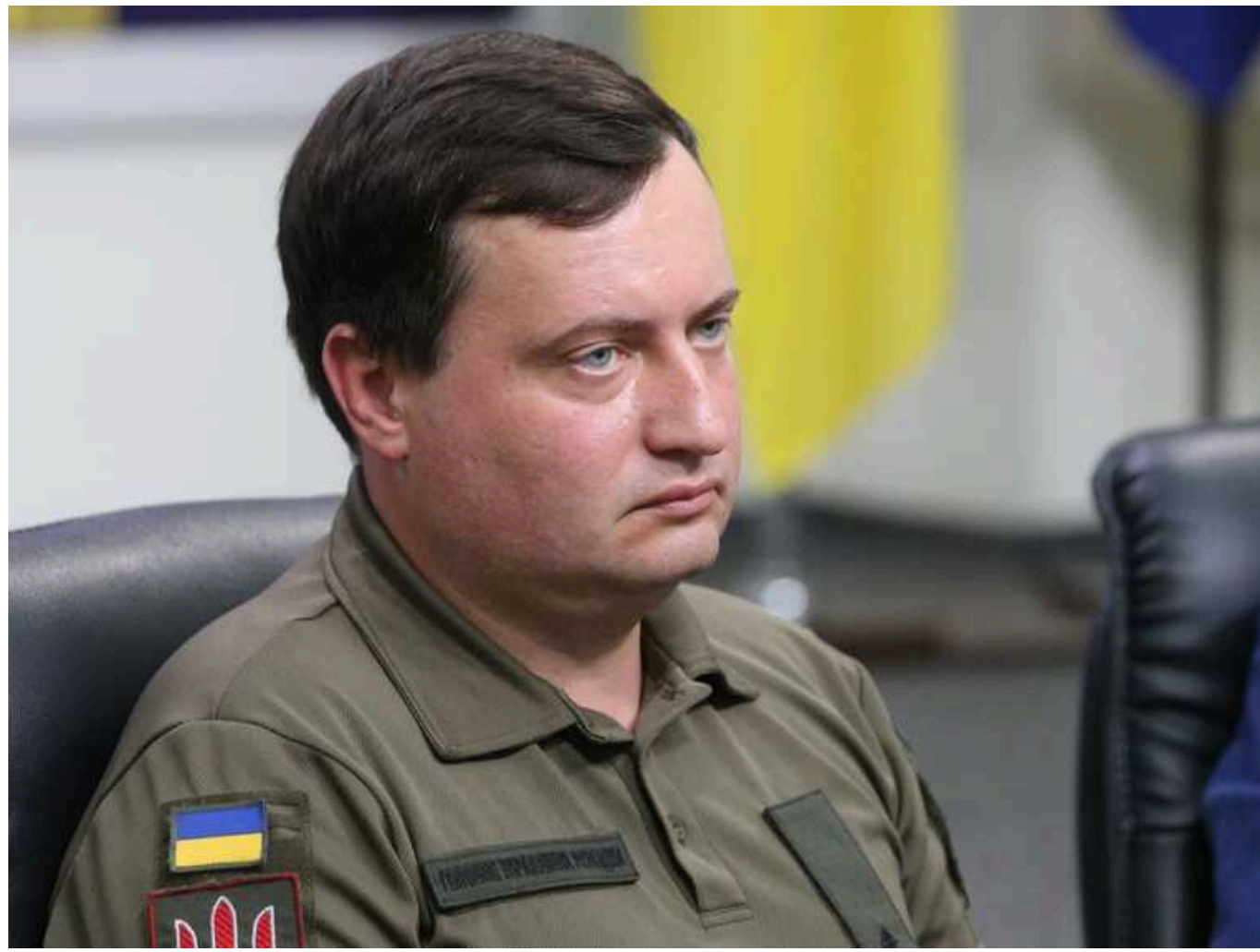
Юсов про вибух на НПЗ у Самарській області: інцидент там був

На Новокуйбишевському нафтопереробному заводі у Самарській області РФ в ніч проти 23 березня спалахнула пожежа, і лунали вибухи. За даними української розвідки, там "відбувся інцидент".