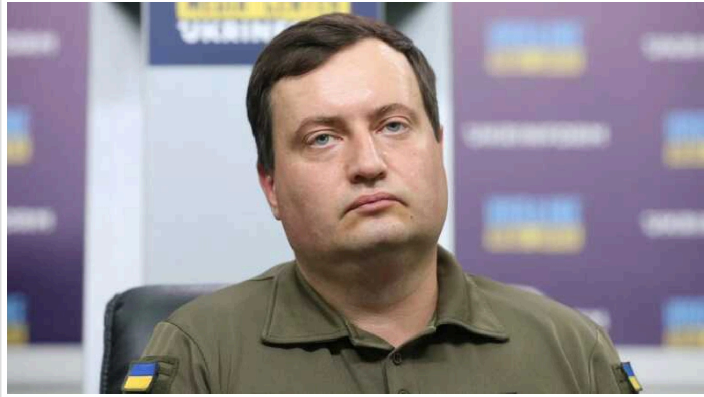
У ГУР МО заперечують, що підозрювані в теракті у «Крокусі» намагалися втекти до України

Російська ФСБ заявила, що нібито підозрювані у скоєнні теракту в "Крокус Сіті Холлі" під Москвою хотіли втекти до України. ГУР заперечує це.