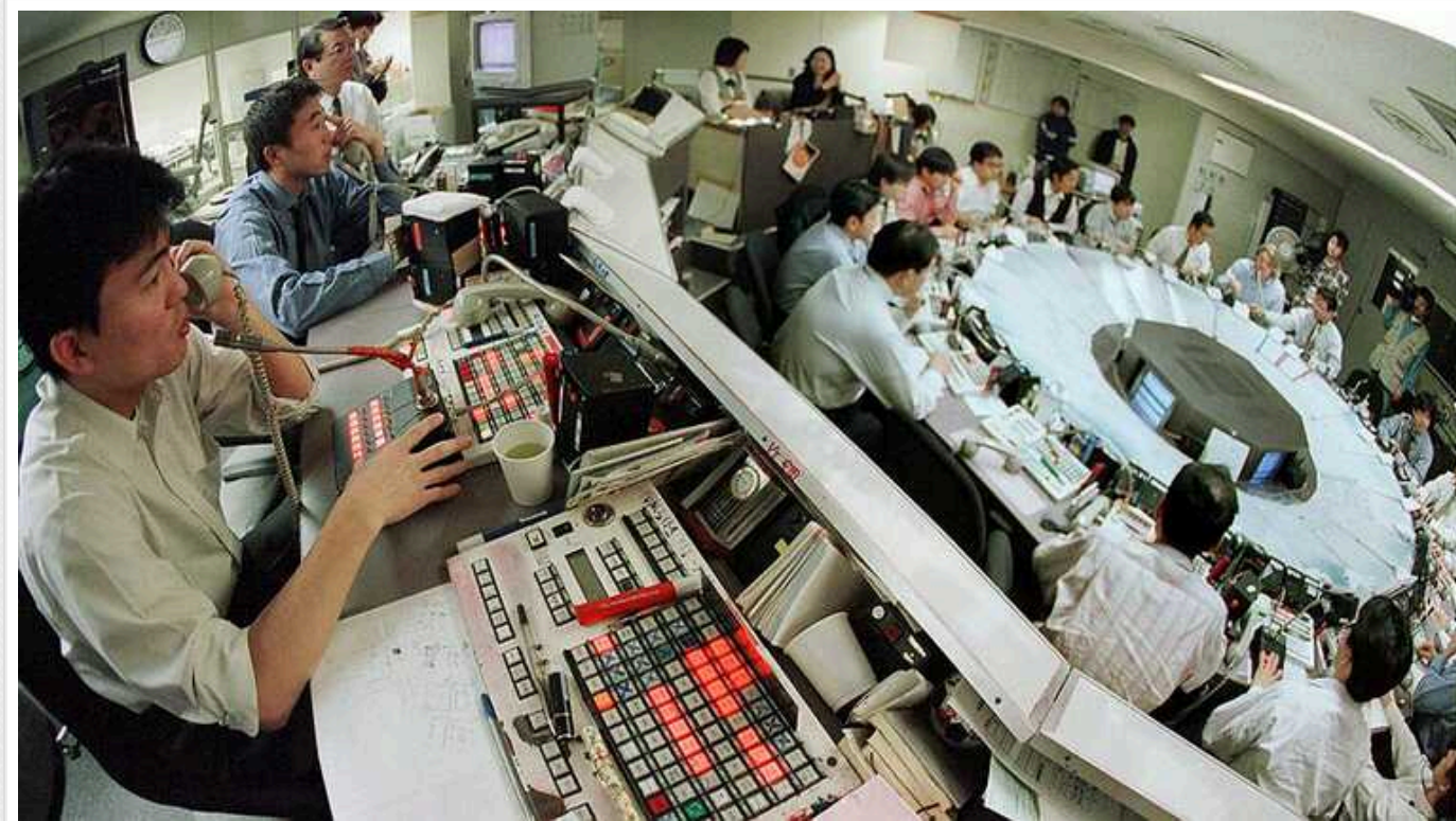
В Японії продовжується фондовий бум

Японські акції продовжують зростати навіть попри перше за довгий час підвищення облікової ставки.