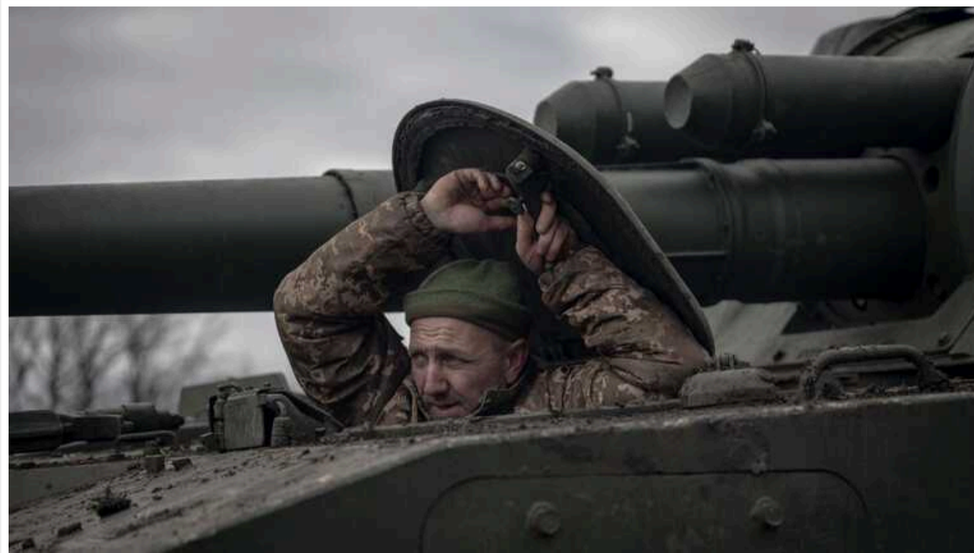
Ситуація на фронті: ворог завдав 88 ракетних та 143 авіаційних удари

В Україні на фронті впродовж доби відбулося 69 бойових зіткнень. Ворог активно намагається наступати на Новопавлівському та Авдіївському напрямках.