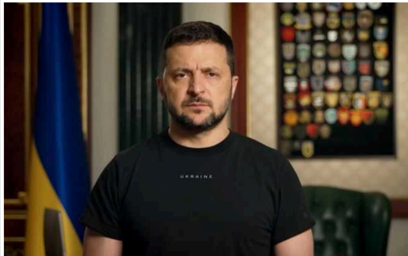
Зеленський: Російський терор можливий, бо Україні не вистачає ППО

Читати на руськом Read in English Додати як бажане джерело в Google