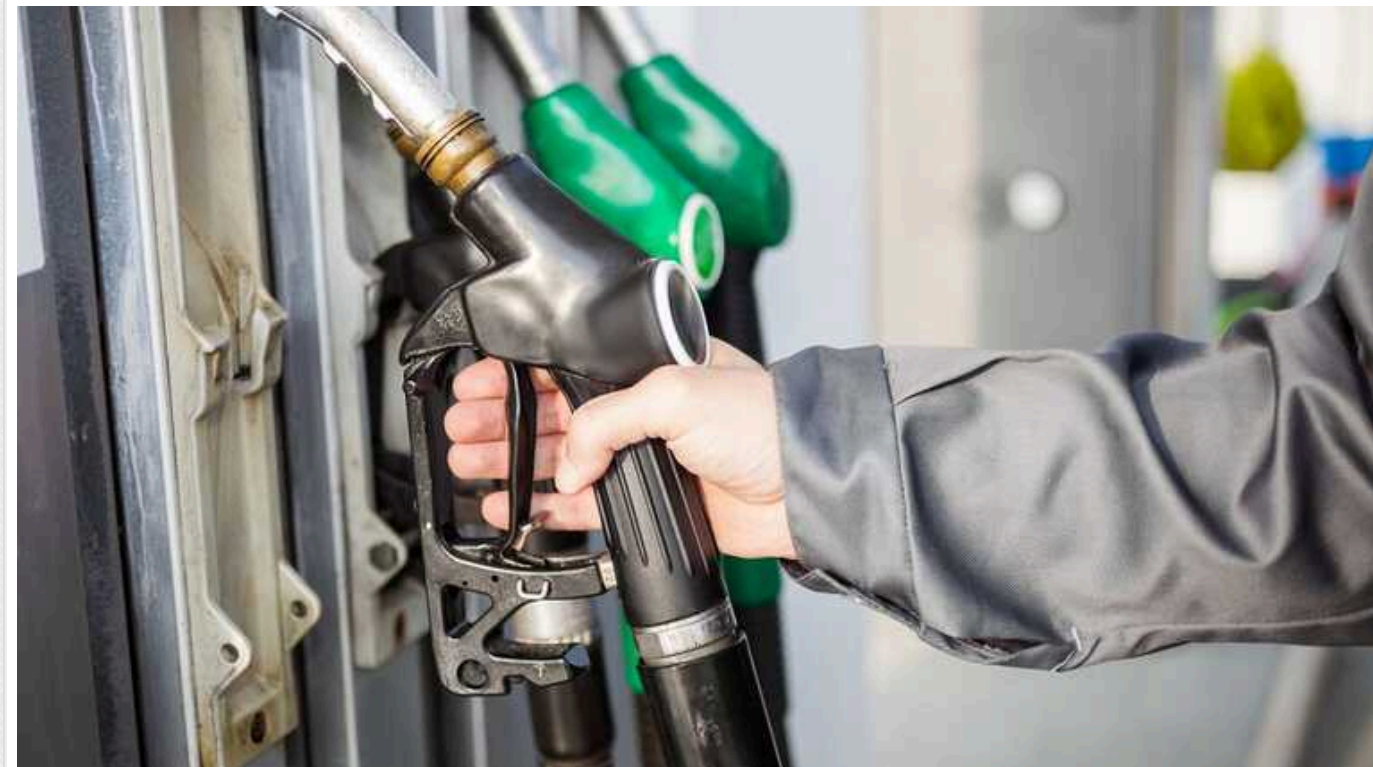
КМУ затвердив законопроект щодо підвищення акцизів на пальне: можливе подорожчання

Кабмін України затвердив законопроект щодо підвищення на нього акцизів. Як сказано у заяві, це зроблено для "наближення національного законодавства до законодавства Європейського Союзу".