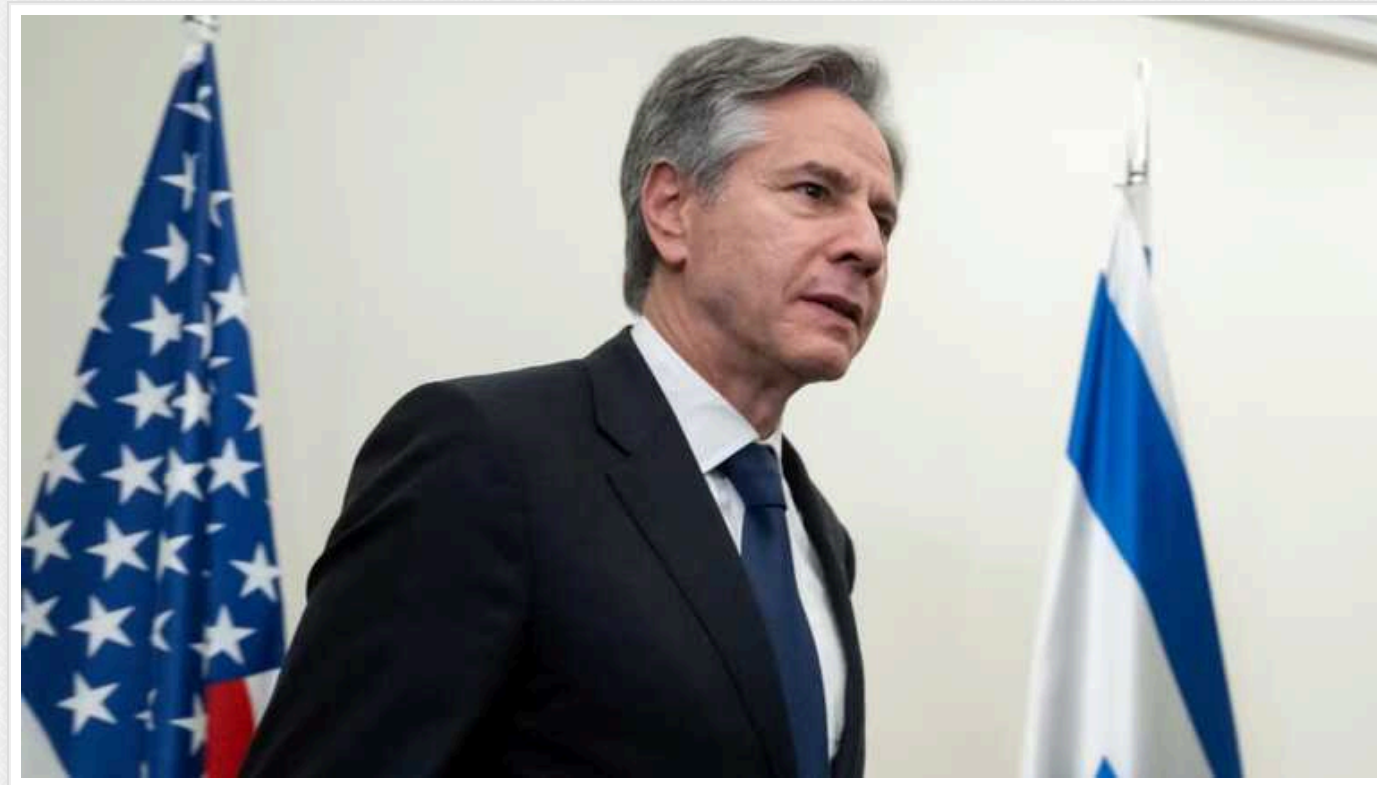
Блінкену не вдалося переконати Нетаньягу відмовитися від операції в Рафаху

Після зустрічі з держсекретарем США Ентоні Блінкеном прем'єр Ізраїлю Беніамін Нетаньягу заявив, що ЦАХАЛ готова провести цю операцію й без підтримки Вашингтона.