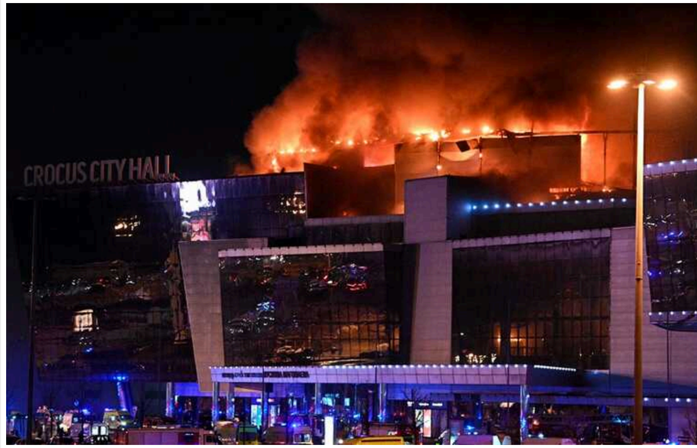
Ситуація біля ТЦ Crocus City Hall зараз: будівля палає, з неї виносять загиблих і поранених

Зараз триває евакуація людей із Crocus City Hall та штурм, у якому беруть участь спецназ Росгвардії та ФСБ, нападники забарикадувалися в одному з приміщень, пишуть російські ЗМІ.