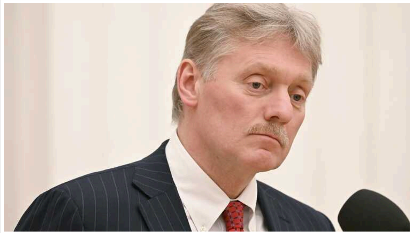
В Естонії пояснили заяву Кремля про війну Росії проти Заходу та України: "Нічого не змінює"

Міністр оборони Естонії Ханно Певкур розповів, що ситуацію в Україні балтійську державу та партнери весь час розглядали як військову агресію Росії, тож у заяві Кремля немає нічого дивного.