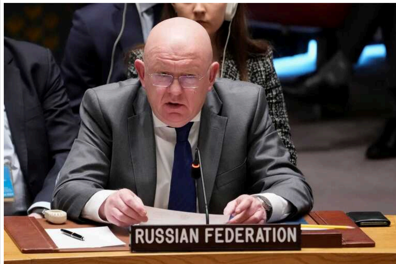
Небензя заявив про виконання мети СВО щодо демілітаризації України

Мета проведення спеціальної військової операції (СВО) щодо демілітаризації України виконана, оскільки Київ тримається тільки завдяки зброї НАТО.