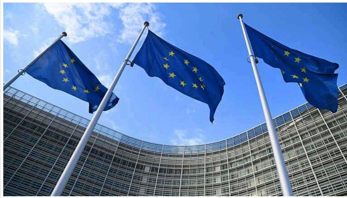
WP: У ЄС планують частину заморожених активів РФ залишити на судові суперечки з Росією

Видання The Washington Post пише, що в ЄС планують частину заморожених активів РФ залишити на судові суперечки з Росією.